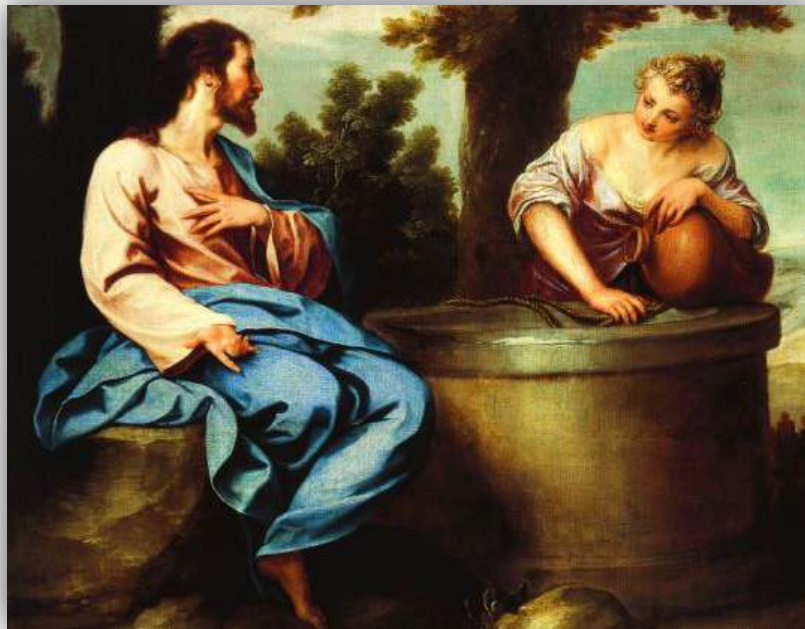
Détail de la peinture, « Jésus et la Samaritaine » d'Alonso Cano. Académie royale des Beaux-arts de San Fernando.