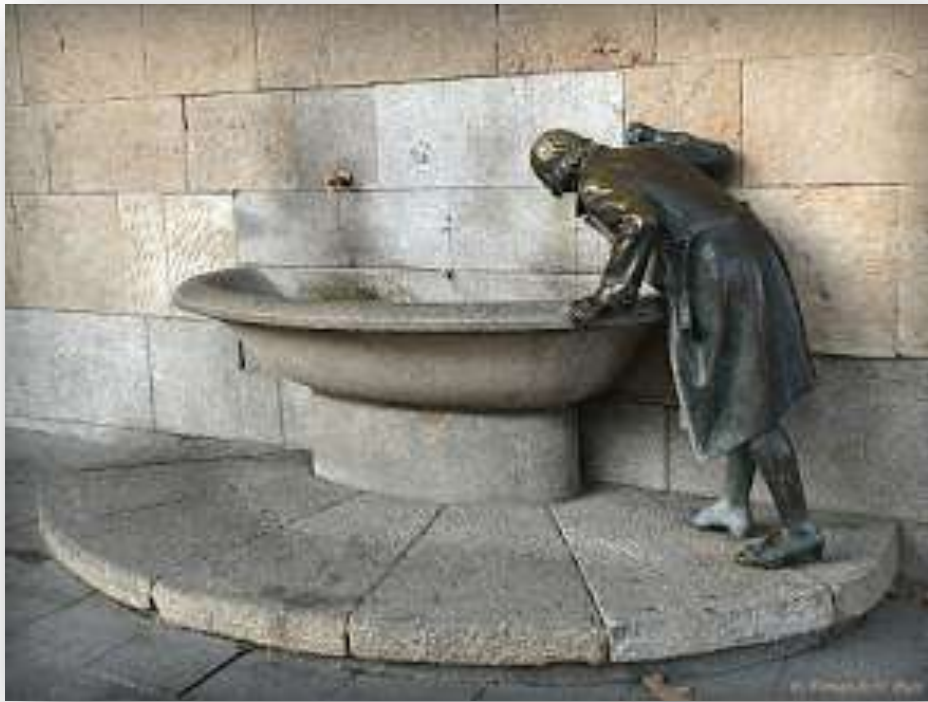
« Dame de la source ». Source de l'Ayuntamiento de Logroño et Statue de bronze de Francisco López (1932).