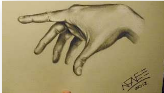
Esos dedos que señalan. Dibujo a lápiz y creta blanca. Natalia Núñez